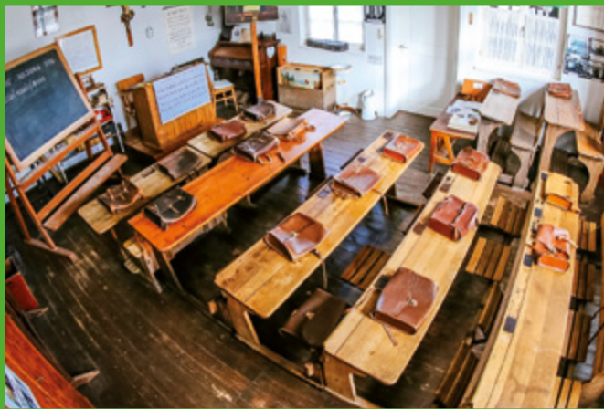
Der historische Klassenraum

Im Dorfschulmuseum in Hövelhof-Riege bekommen Besucher einen Einblick in den Schulalltag vergangener Tage. Der historische Klassenraum zeigt die Einrichtung einer Schule um 1815. Alte Unterrichtsmaterialien und liebevoll überlebte Überbleibsel wie Tinte und Tintenfass, Ranzen und alte Schulbücher, Schiefertafeln und Rechengeräte aus vergangenen Tagen erzählen ihre Geschichten. Bereits im Schulflur sind historische Exponate der Schulausstattung von vor über 100 Jahren zu finden. In weiteren Räumen sind über 2000 Schulbücher sowie Arbeitsmittel und Geräte aus allen früheren Epochen der Schulgeschichte archiviert.