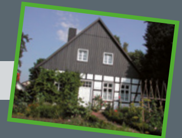
Blick in den Schulgarten

Die ursprüngliche Reformidee zur Volksschule war die Errichtung eines Schulgartens. Zur angestrebten Unterrichtsmethode gehörte die Förderung verschiedener Handfertigkeiten, besonders der praktische Unterricht im Obst- und Gartenbau. Der Schulgarten hatte aber auch eine menschliche Funktion. Da das Gehalt der Lehrer meist nicht für den Lebensunterhalt reichte, stellte die Gemeinde dem Lehrer den Schulgarten zum Gemüseanbau zur Verfügung.