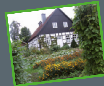
Blumenpracht im Schulgarten